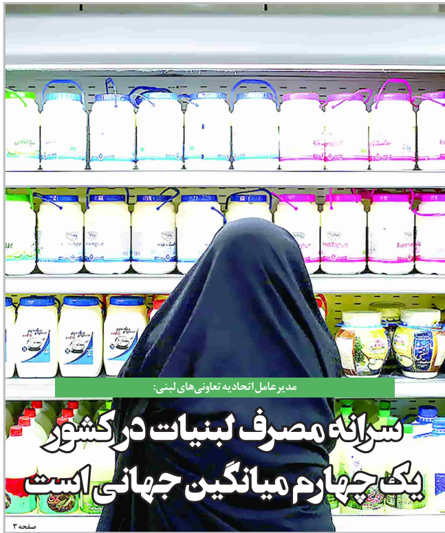
مدیرعامل اتحاد به تعاونی‌های لبنی: